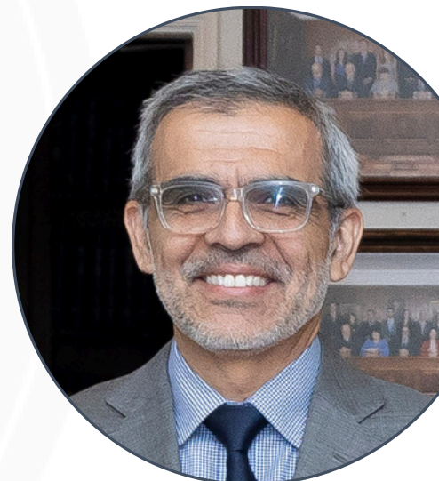
LUIS CORDERO VEGA Ministro de Justicia

El segundo panel versó sobre acceso a la justicia, analizando, principalmente, el proyecto del nuevo Servicio Nacional de Acceso a la Justicia y la Defensoría de las Víctimas, que tendrá incidencia en mejorar la prestación de asistencia jurídica a la población y modificará la forma de realizar las prácticas profesionales, respecto de lo cual el Ministro de Justicia respondió diversas preguntas de los asistentes.