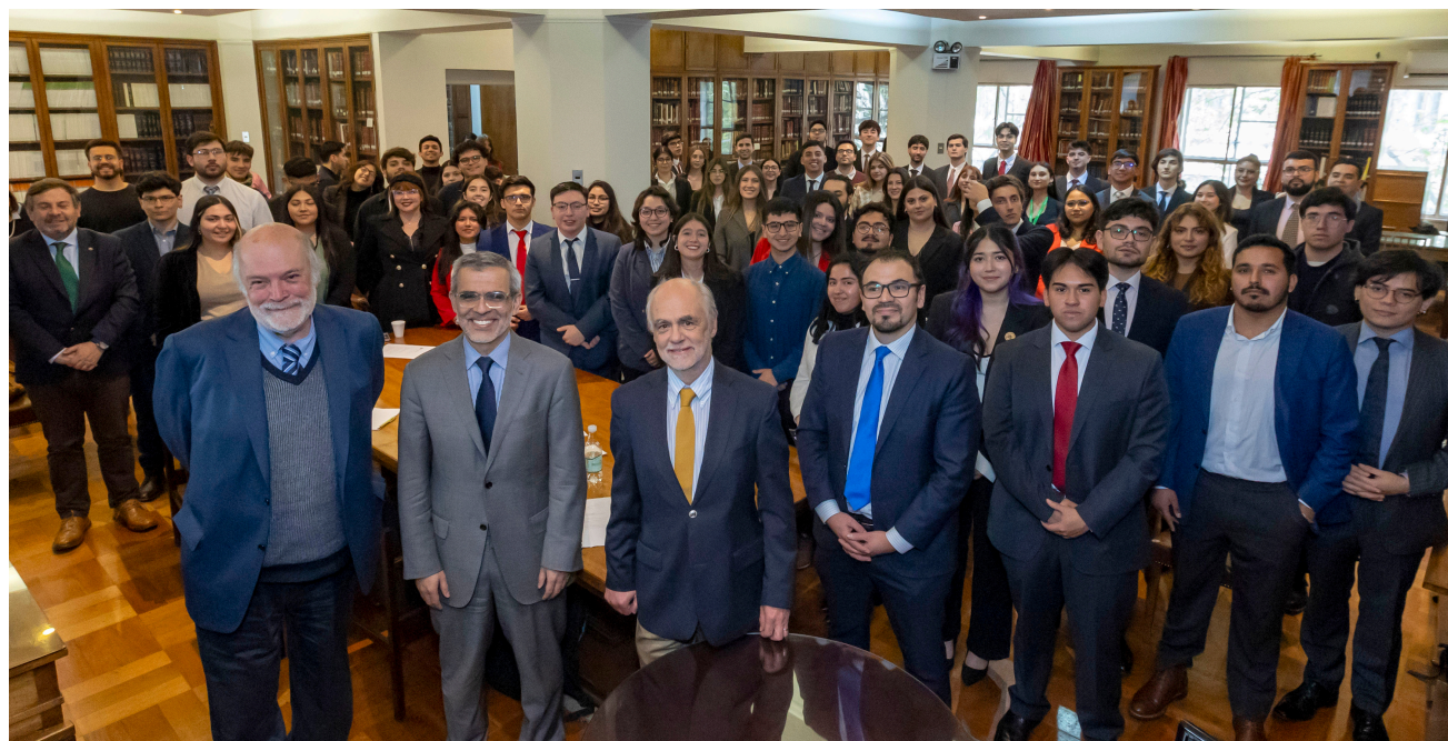
Fotografía: centros de estudiantes se reúnen en la biblioteca del Colegio de Abogados