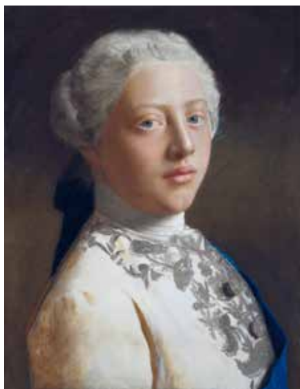
"Jorge III" (1754), pastel sobre pergamino. Royal Collection, Reino Unido.

Sin embargo, es en el género del retrato donde este eximio pastelista del rococó (que conocía la obra de Rosalba Carriera y de Maurice Quentin de La Tour) alcanzó la cima de popularidad a lo largo del continente europeo. De vocación cosmopo-