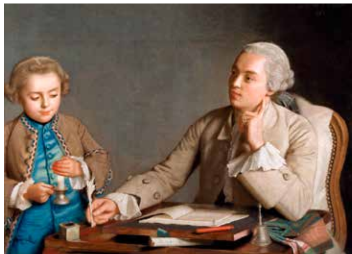
"L'écriture" (1752), Kunsthistorisches Museum, pastel sobre papel. Viena.

E mergiendo, desde una combinación de matices apastelados, se presentan netos, hoy como ayer, desayunos y escribanías del siglo XVIII pertenecientes al acervo cultural de Jean-Étienne Liotard. Puede comprenderse mejor sus escenas domésticas, si se toma nota de su personal gusto artístico y de su origen familiar. En efecto, Liotard buscó la verosimilitud y precisión naturalista que se halla en la pintura de interiores holandesa del siglo XVII, que admiró y coleccionó. A esa fórmula agregó la sensualidad del rococó francés, de tonos ameren-gados y sedosos, y el interés por la elegancia y la moda, característico del alma francesa en el Siglo de las Luces. Y es que, habiendo nacido en Ginebra, Sui-