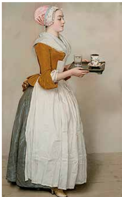
"La bella chocolatera" (1745), pastel sobre pergamino. Gemäldegalerie Alte Meister, Dresde.

escenas cotidianas y pulcras, se ha verificado un punto de coincidencia con las pinturas de género de Jean Baptiste Siméon Chardin, pintor del rococó francés, a quien se sabe Liotard conoció.